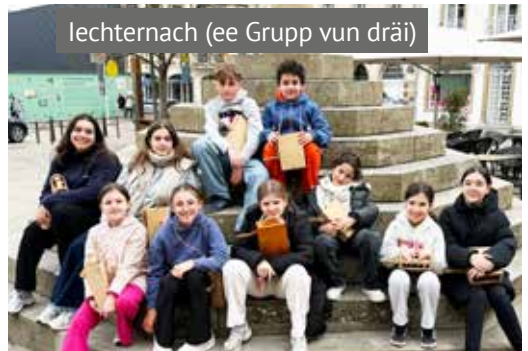
Iechternach (ee Grupp vun dräi)